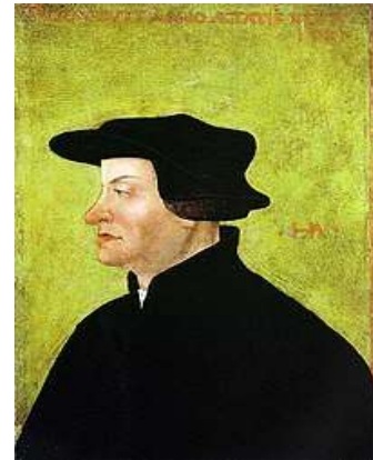
Retrato de Ulrico Zuinglio por Hans Asper , hacia 1531.

Mientras que el grupo de anabaptistas crecía, empezaba a despertar una gran oposición tanto por católicos como por los reformadores. El pacifismo extremo que practicaban los anabaptistas, se convirtió también en una molestia para quienes querían mantener el orden social y político. Las posturas iniciales que diferenciaban a los anabaptistas de los protestantes y católicos, eran el hecho de que creían que las autoridades seculares no debían gobernar o interferir en los asuntos de la iglesia.